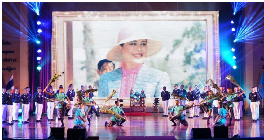
ภาพที่ ๓ การเผยแพร่ผลงานสร้างสรรค์การแสดง ณ โรงเรียนเตรียมทหาร

ผู้สร้างสรรค์ผลงานได้ดำเนินการเผยแพร่ในลักษณะการแสดงในกิจกรรมโครงการ “เติร์ยมทหารรวมใจ สืบสานศิลปวัฒนธรรมไทย เติร์ยมแม่แห่งแผ่นดิน” เฉลิมพระเกียรติสมเด็จพระนางเจ้าสิริกิติ์ พระบรมราชินีนาถ พระบรมราชชนนีพันปีหลวง ในโอกาสมหามงคลเจริญพระชนมพรรษา ๘๘ พรรษา ในวันที่ ๑๙ สิงหาคม ๒๕๖๓ ณ หอประชุมนวมครินทร์ โรงเรียนเตรียมทหาร โดยมีผู้เข้าชมผลงาน รวมจำนวน ๗๐๐ นาย ดังนี้ ผู้ทรงคุณวุฒิกองบัญชาการกองทัพไทย จำนวน ๑ นาย, ที่ปรึกษาสถาบันวิชาการป้องกันประเทศ จำนวน ๑ นาย, ผู้บังคับบัญชาของโรงเรียนเตรียมทหาร พร้อมคู่สมรส และกำลังพลของโรงเรียนเตรียมทหาร จำนวน ๘๖ นาย, คณะครู-อาจารย์โรงเรียนมัธยมศึกษาในจังหวัดนครนายก จำนวน ๑๒ นาย, นักเรียนเตรียมทหาร ชั้นปีที่ ๑ จำนวน ๓๐๐ นาย และนักเรียนเตรียมทหาร ชั้นปีที่ ๒ จำนวน ๓๐๐ นาย