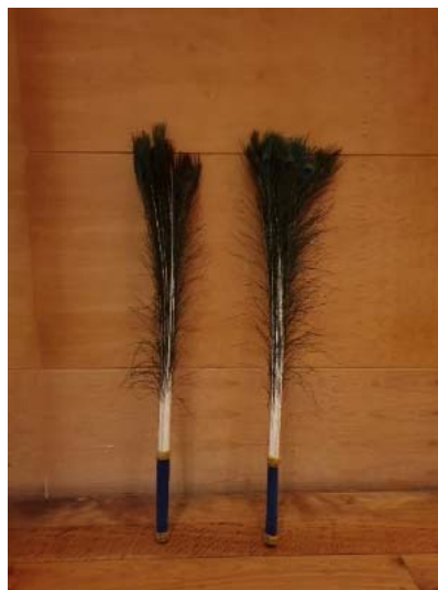
ภาพที่ ๒ หางนกยูงที่ใช้เป็นอุปกรณ์การแสดง

วิธีการนำหางนกยูงมาใช้เป็นอุปกรณ์ประกอบการแสดง คือ คัดหางนกยูงที่มีขนาดความยาวประมาณ ๘๐-๑๒๐ ซม. มามัดรวมเข้าด้วยกันแล้วพันด้วยกำมะหยี่สีน้ำเงิน เป็นกำ ๆ ละ ๔๔ เส้น และตกแต่งด้วยแถบสีทอง โดยผู้แสดง ๑ คน จะใช้หางนกยูงจำนวน ๒ กำ รวมเป็น ๘๘ เส้น เท่ากับพระชนมพรรษาของสมเด็จพระนางเจ้าสิริกิติ์ พระบรมราชินีนาถ พระบรมราชชนนีพันปีหลวง