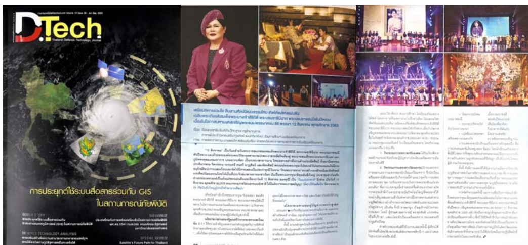
ภาพที่ ๕ การเผยแพร่รูปแบบเอกสารทางวิชาการ ที่มา : ผู้สร้างสรรค์, ๒๕๖๔.

ผู้สร้างสรรค์ผลงานได้เผยแพร่ผลงานสร้างสรรค์รำถวายพระพร ชุด เตรียมทหารรวมใจถวายพระพรชัยแม่แห่งแผ่นดิน และกิจกรรมเตรียมทหารร่วมใจ สืบสานศิลปวัฒนธรรมไทย เทิดไถ้แม่แห่งแผ่นดิน เฉลิมพระเกียรติสมเด็จพระนางเจ้าสิริกิติ์ พระบรมราชินีนาถ พระบรมราชชนนีพันปีหลวง ในโอกาสสมหามงคลเฉลิมพระชนพรรษา ๘๘ พรรษา โดยการเขียนบทความลงในวารสารเทคโนโลยีป้องกันประเทศ Volme 10 Issue 39 : Jul-Sep. 2020 (ISSN 2229-1040) หน้า ๘-๙