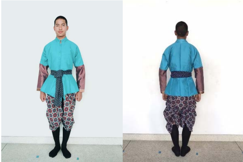
ภาพที่ ๑ เครื่องแต่งกาย